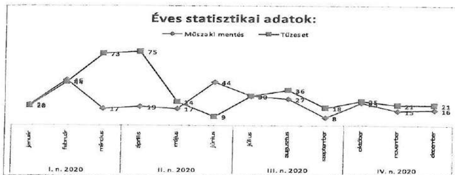
Tűz és műszaki mentések száma havi bontásban:

2020. év január 01-től december 31-ig a következő események történtek a Bgy KvK illetékességi területén: