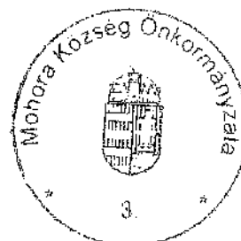
Gulyás Géza s. k. polgármester